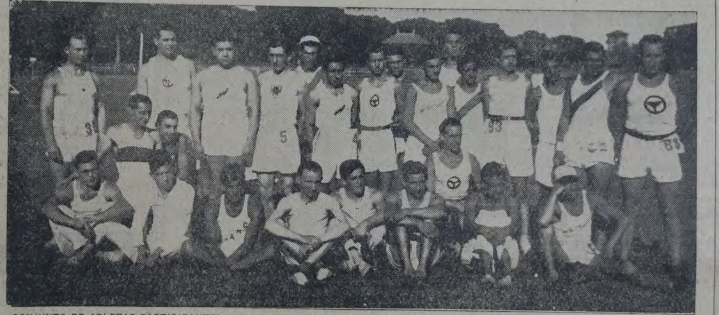
CONJUNTO DE ATLETAS PARTICIPANTES DEL SEGUNDO TORNEO CON VENTAJA, ORGANIZADO POR LA FEDERACION ATLETICA ARGENTINA