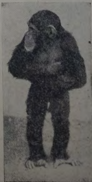
UN PUPILO DEL PARQUE ZOO. lógico de Stellingen

Tal es el interesante personaje que presentamos a nuestros amigos del "Rincón de los Niños" y cuyas principales aventuras por selvas y países salvajes los iremos relatando semanalmente en el suplemento.