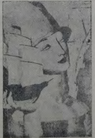
JEAN DUPAS — Mujer con navío

obra importante. Entre sus producciones se destacan "Les achers", "Suzanne", "Le jugement de Paris", "Les pigeons", "Le vin", "Les antilopes". Todos estos trabajos figurán en el pabellón de Burdeos de la Exposición de artes decorativas. Realizó después, "Les Perruches" y las decoraciones para el transatlántico "De de France".