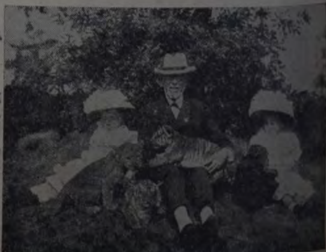
HAGENBECK EN FAMILIA