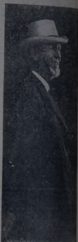
CARLOS HAGENBECK, EL FAMOSO explorador alemán que fundó el Parque Zoológico de Stellingen, en Hamburgo.

Tanto perfeccionó Hagenbeck su parque zoológico que, a su muerte, ocurrida hace más o menos 15 años, aquel parque era el más per-