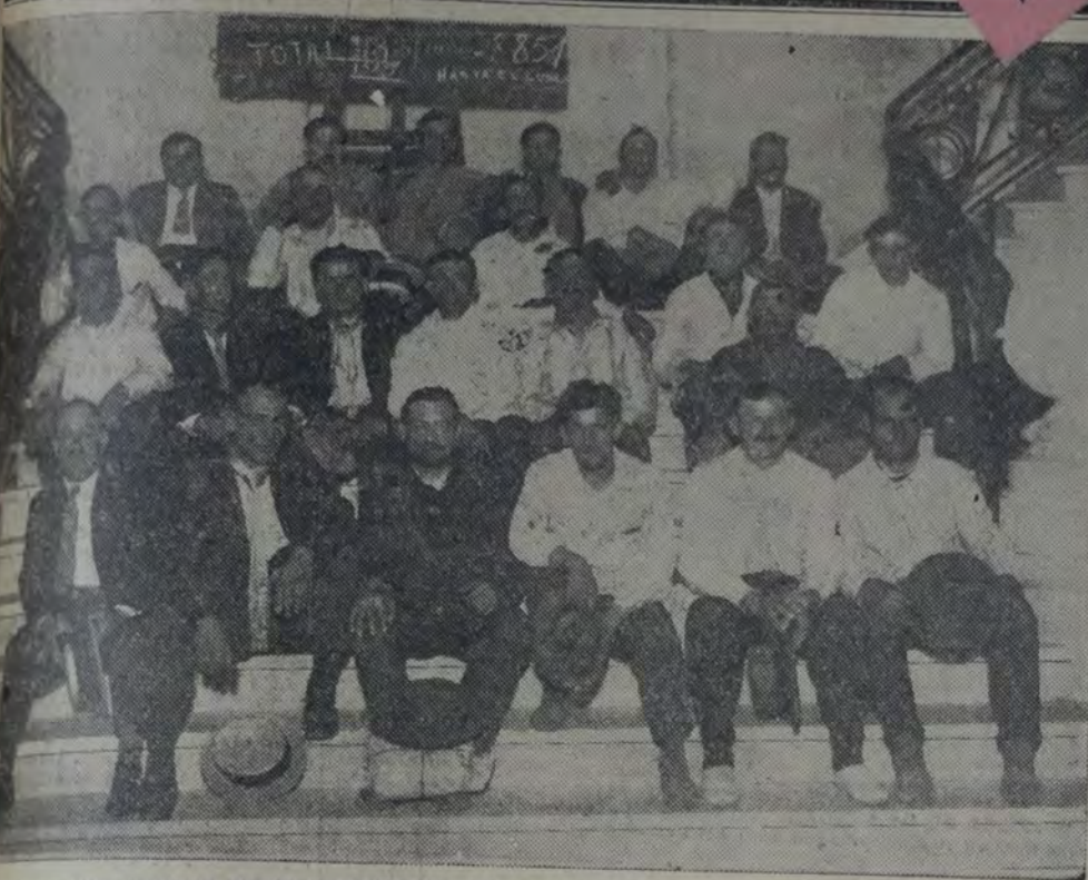
GRUPO DE HUELGUISTAS QUE SE APERSONO A LAS OFICINAS DE NUESTRO DIARIO PARA COMENZAR la iniciación del conflicto en las estaciones Once y Caballito y sus causas. (Ver crónica en la página Movimiento Gremial)

TELEFONOS: Redacción: 47 Cuyo 7321 Administración: 47 Cuyo 7304