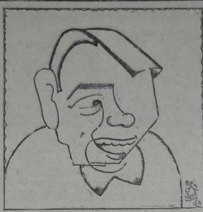
EL CELEBRADO ACTOR COMICO DE LA METRO-GOLDWYN-MAYER, de quien se anuncia una nueva película para el mes próximo