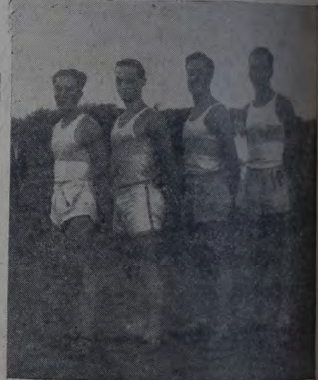
EQUIPO DEL CLUB GIMNASIA Y ESGRIMA, GANADOR DE LA POSTA DE 4 x 100