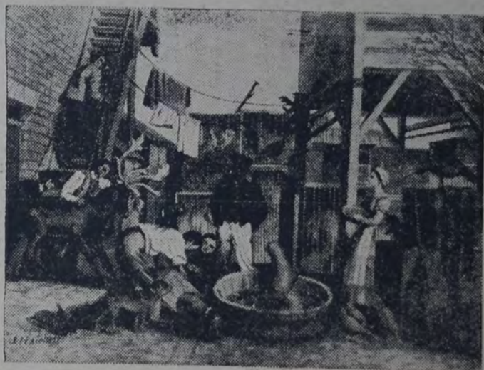
EL PRIMITIVO COMERCIO DE VENTA DE ANIMALES DE LA FAMILIA Hagenbeck, en Hamburgo

Vida y obra de Carlos Hagenbenck, explorador, cazador, domesticador de animales y fundador del parque zoológico de Stellingen que es el más hermoso del mundo