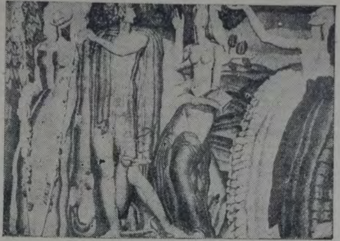
JEAN DUPAS — "Los vinos de Francia" — Fragmento del panneau decorativo para el pabellón de Burdeos