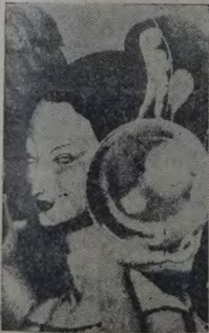
JEAN DUPAS — Mujer con esfera

món. Utiliza el lápiz negro y ligeros toques de rojo. Con tan sencillos recursos, obtiene insospechados efectos este incansable trabajador.